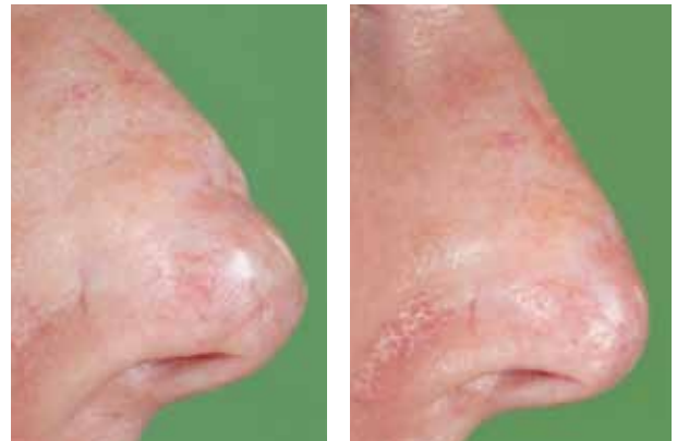
Figuur 1. Zij-aanzicht. Links voor lipofilling, rechts na lipofilling.

Ook controle na 8 maanden liet nog steeds een verbetering van de huid en stabiele bedekking van het kraakbeen bij de neuspunt zien. Zie figuur 1, 2 voor het resultaat. De procedure kan eventueel herhaald worden.